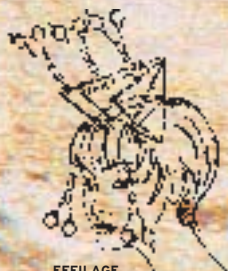
EFFILAGE ET PIQUETAGE

Fujika designed the scissors of its new titanium range combining of all the new technologies and the secular tradition of world famous factories. RTE edge is developed from the special steel of titanium high technology which guarantees a great longevity as well as a sharpening similar to a razor. It allows any type of cut : feathering, slide cutting, texturising, square...RCC screw permits to choose the pressure of the cut according to work to be realized and the hair to be treated. This self-locking screw does not wrong while the cut.