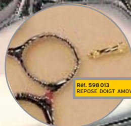
Réf. 598 013 REPOSE DOIGT AMOVIBLE

CUTTING SCISSORS Ysaky Inox Ergo. SIZE 5,5"