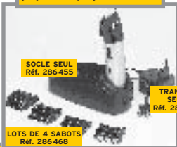
SOCLE SEUL Réf. 286 455