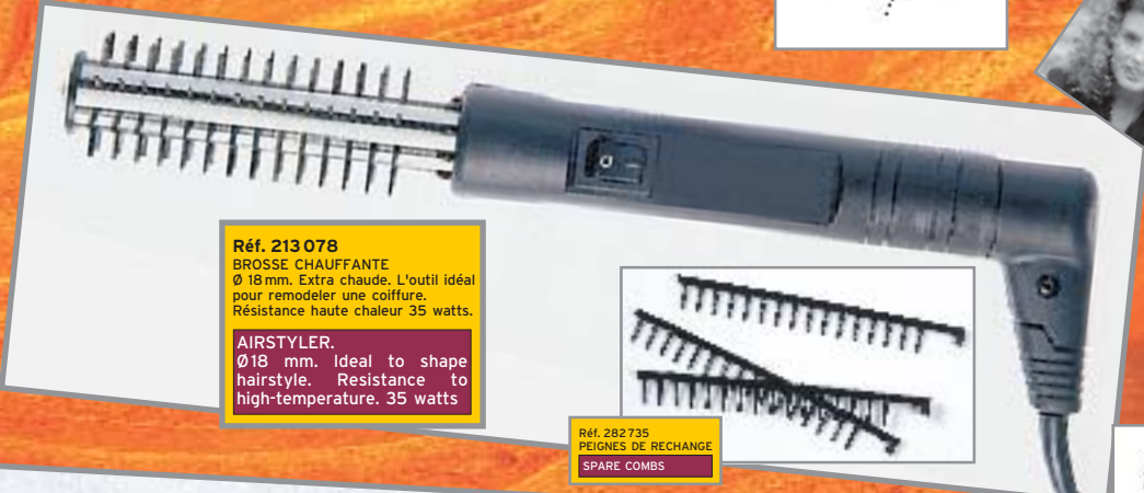
Réf. 213 078 BROSSE CHAUFFANTE Ø 18mm. Extra chaude. L'outil idéal pour remodeler une coiffure. Résistance haute chaleur 35 watts. AIRSTYLER. Ø18 mm. Ideal to shape hairstyle. Resistance to high-temperature. 35 watts