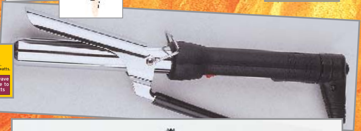
Réf. 213 025 FER Ø 25mm. Pour onduler en souplesse et détendre les cheveux difficiles. Résistance haute chaleur 35 watts. TONGS 25mm. To wave with softness. Resistance to high-temperature 35 watts