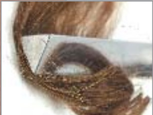
Réf. 213 044 FER TRIANGULAIRE Section 17mm permettant de façonner toutes coiffures structurées. Résistance haute chaleur 35 watts. TRIANGULAR TONGS Section 17mm to shape hairstyle. Resistance to high-temperature 35 watts