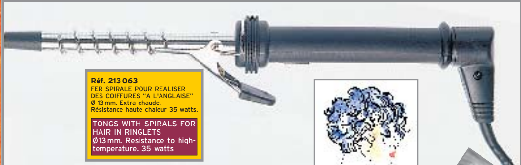
Réf. 213 063 FER SPIRALE POUR REALISER DES COIFFURES "A L'ANGLAISE" Ø 13mm. Extra chaude. Résistance haute chaleur 35 watts. TONGS WITH SPIRALS FOR HAIR IN RINGLETS Ø13 mm. Resistance to high-temperature. 35 watts