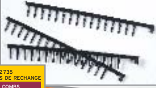
Réf. 282 735 PEIGNES DE RECHANGE SPARE COMBS