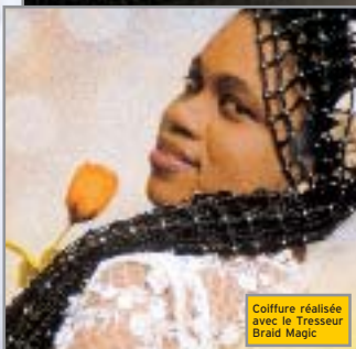
Coiffure réalisée avec le Tresseur Braid Magic