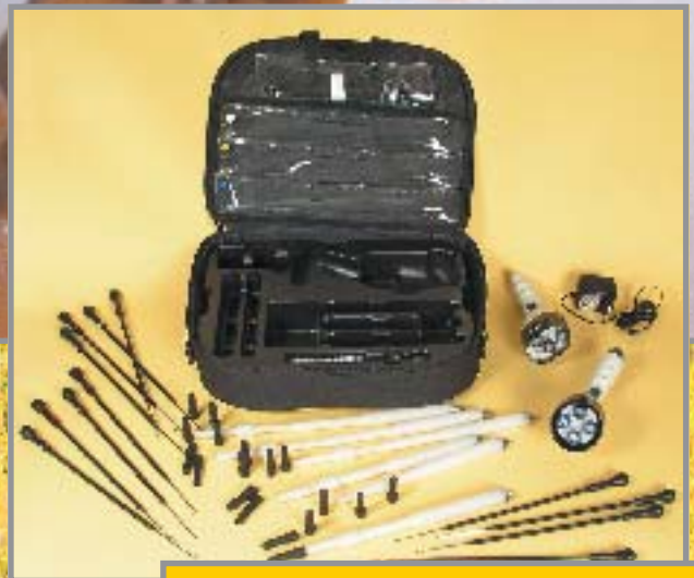
Réf. 211684 KIT DOUBLE TRESSEUR BRAID + TWIST MAGIC. Valise, Braid Magic (Tresse), Twist Magic (Locks), 6 tubes, 12 crochets tire mèche, 12 embouts de tressage, transfo, brosse et manuel.