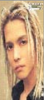
Coiffure réalisée avec le Twister Magic