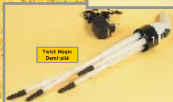
Twist Magic Demi-plié