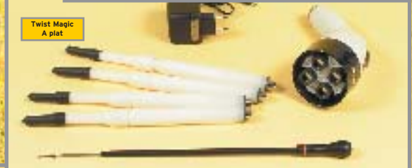
Twist Magic A plat